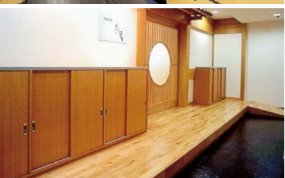
■松風(地下1階) 和宴会場(畳)100席