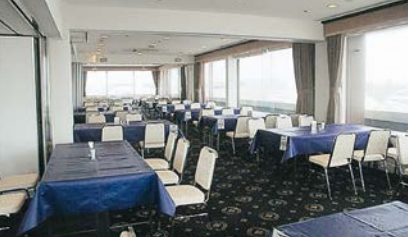
■広福・飲会 洋宴会場120席 ※広福と飲会の2会場をつなげて大きなL字型でご利用できます。