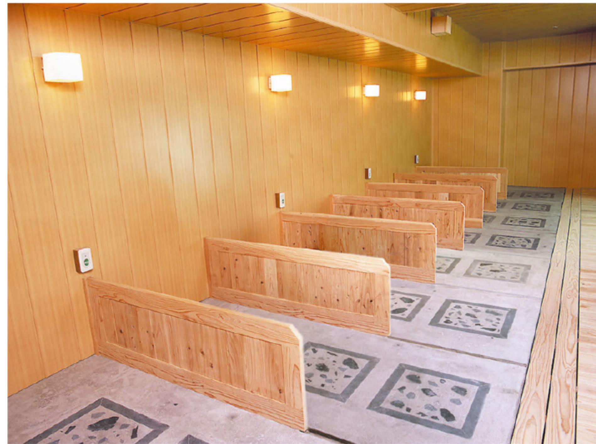
●岩盤浴室 Radium Rock Bath

BENEFITS Health and figure, smooth skin, good blood circulation, revival and freshen up, and other effects.